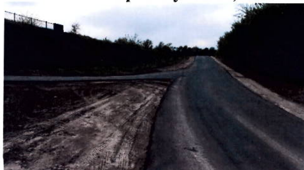
после проведения работ