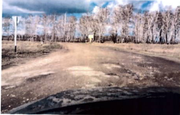
до проведения работ

На всем протяжении данной автодороги в 2018 году выполнены работы по устройству асфальтобетонного покрытия.