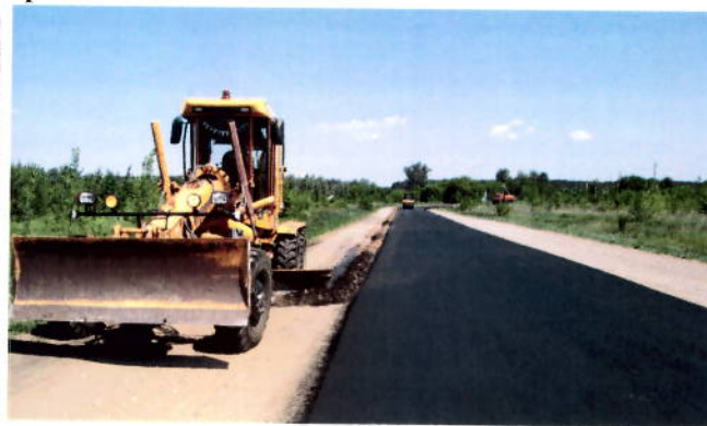
после проведения работ