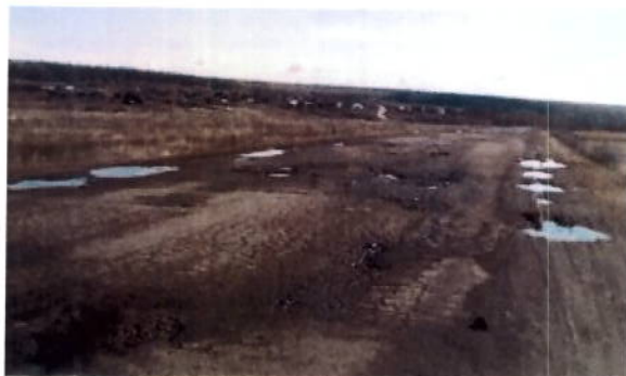
до проведения работ

По данной автодороге на 2017 год, в рамках заключенного государственного контракта на содержание автодорог, выполнен ямочный