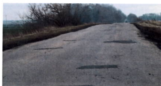
после проведения работ

В 2018 году выполнены работы на общей площади 959 м 2 на сумму 0,7 млн. рублей. В 2019 году выполнены работы по ремонту покрытия методом «карт» протяженностью 3 км.