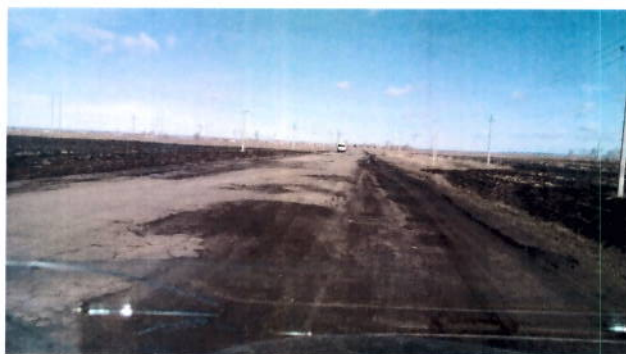
до проведения работ