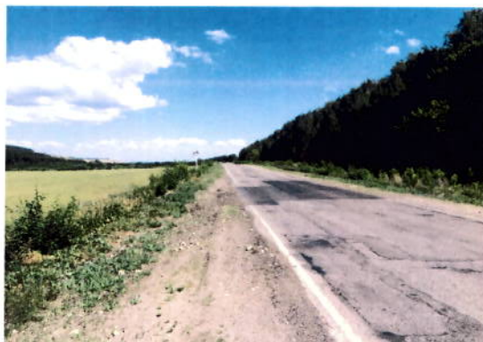
после проведения работ

Учитывая, что данный дефект имеет локальный характер, работы по его ликвидации выполнены в полном объеме.