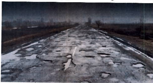
Участок изображенный на фото не находится на данной дороге

1 автодорога «Труслейка-Тяпино-Чамизинка» Инзенского района, на участке между селами Аргаш и Тяпино