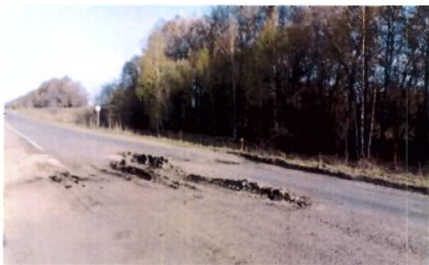
до проведения работ