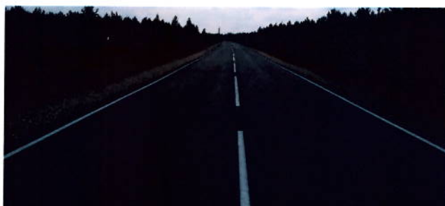
после проведения работ