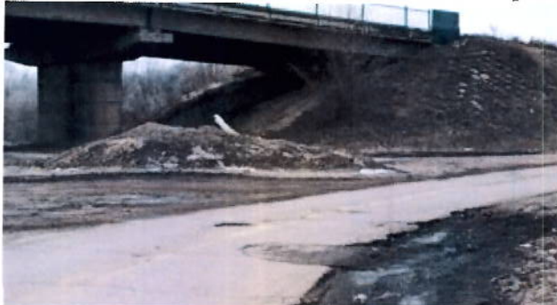
до проведения работ

4 выезд из р.п. Новоспасское на транспортную развязку, расположенную на км 125 автодороги С. Ташла-Старая Кулатка;