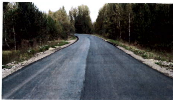
после проведения работ