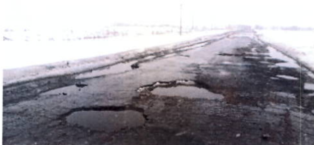
до проведения работ

На автомобильной дороге «Димитровград-Чувашский Сускан» - Дивный» протяженностью 4,2 км., силами подрядной организации выполнен ямочный ремонт дорожного покрытия. Проезд обеспечен.