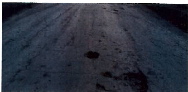
до проведения работ

По данной автодороге в 2018 году, в рамках приоритетного проекта «Безопасные и качественные дороги» выполнен ремонт обозначенного участка протяженностью 3,7 км.