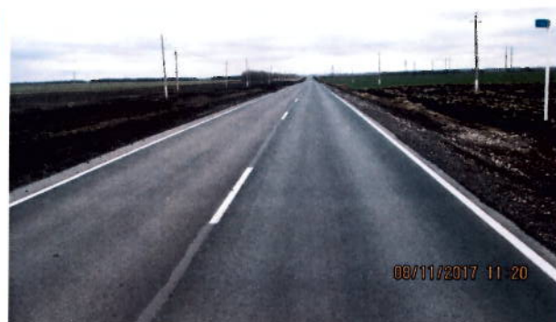
после проведения работ

В 2017 году в рамках заключенного государственного контракта на ремонт автодорог проведены работы по ремонту дорожного покрытия методом «карт» в районе с. Александровка – ст. Якушка протяженностью 2,0 км на сумму 23,2 млн. рублей.