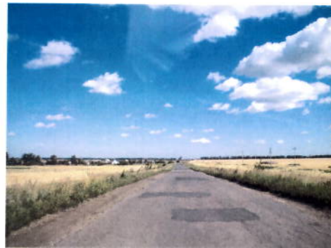
после проведения работ

ремонт покрытия на сумму 0,2 млн. рублей, в том числе и струйно-инъекционным методом. В 2018 году выполнены работы по устранению дефектов покрытия на общей площади на общей площади 926 м 2 на сумму 0,65 млн. рублей. В 2019 году выполнены работы по устранению дефектов покрытия на общей площади на общей площади 2899 м 2 .