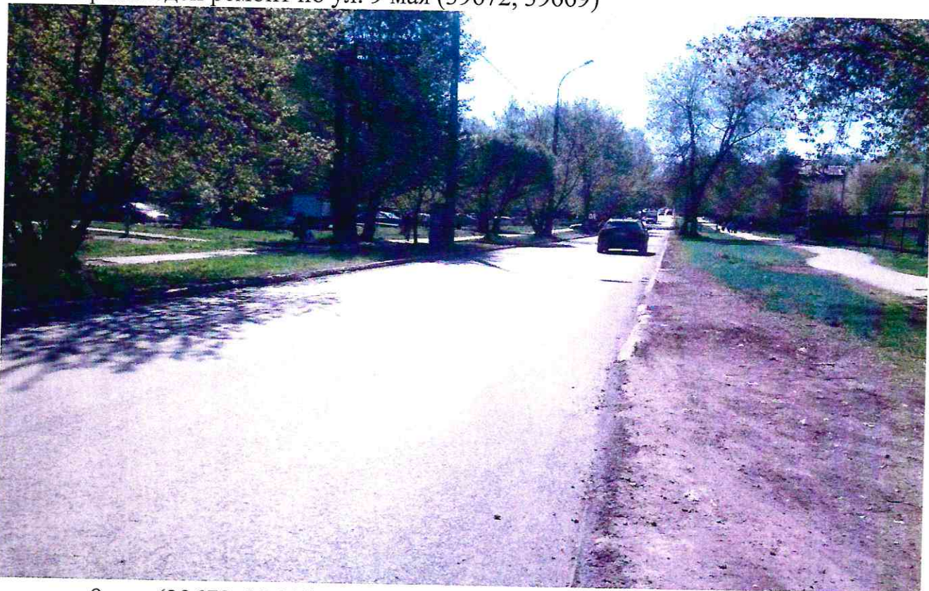
ул.9 мая (39672, 39669)

Индустриальный район. Произведен ремонт по ул. 9 мая (39672, 39669)