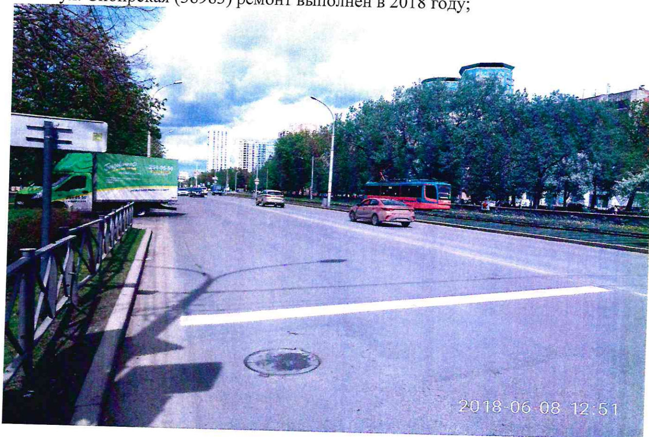
ул. Краснофлотская (38249) ремонт выполнен в 2018 году.