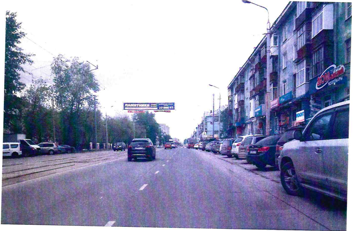
Произведен ремонт по ул. Мира (39510)